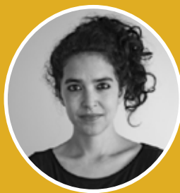
Amaranta Morales Production / Programmation @amarantamorales