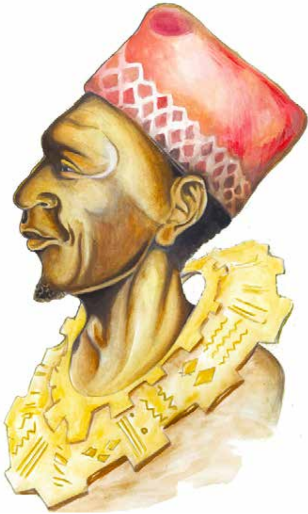
Portrait Makoko

La Fondation QAFF traverse les continents, s'enrichit des émotions et du savoir-faire des autres cultures. Vagabondant avec ce plaisir de se déplacer entre des coutumes similaires séparées par un repère historique. Nous côtoyons et apprenons de la réalité de personnes qui nous entourent au quotidien.