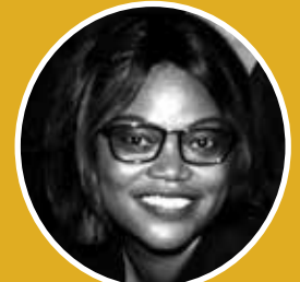
Hope MAMS TSO Fund Riser @hopemadhone